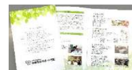
法人パンフレット