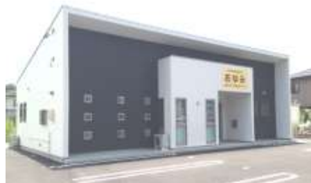
4日にオープンするNPO法人あゆみ新事務所（知多市岡田）

NPO法人りんりん(半田市)では、新たに土地を確保し放課後児童クラブの新拠点を建設。多世代交流事業の「サロンごえん」や「岩滑お助け隊」など高齢世代の